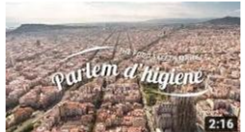
Parlem d'higiene - Seguretat Alimentària