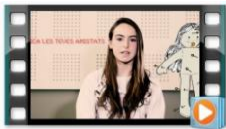
Prou violència masclista!