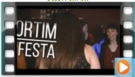
Campanya 'Jo sóc la festa!'