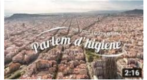
Parlem d'higiene - Seguretat Alimentària