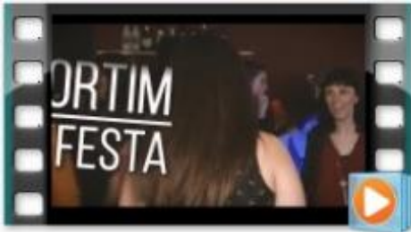
Campanya 'Jo sóc la festa!'