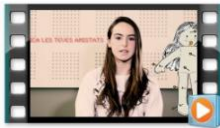
Prou violència masclista!