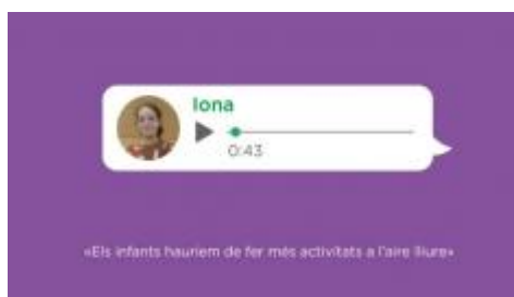
ODS - Salut i Medi Ambient