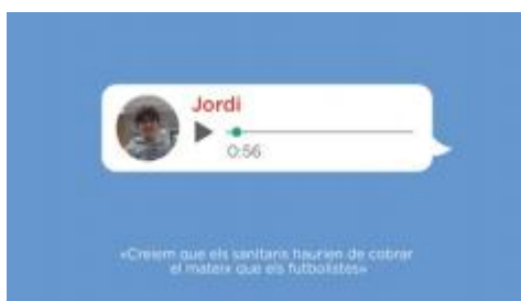
ODS - Salut i Medi Ambient

Organitza: Associació Espanyola Contra el Càncer + info