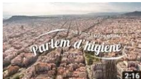
Parlem d'higiene - Seguretat Alimentària