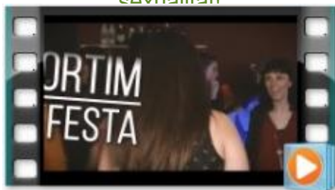
Campanya 'Jo sóc la festa!'