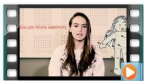
Prou violència masclista!