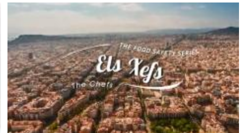
Els xefs - Seguretat Alimentària