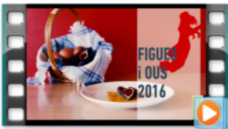
Gaudeix obertament de la teva sexualitat!

*Acte emmarcat dins la campanya del Dia Internacional d'Acció per la Salut de les Dones