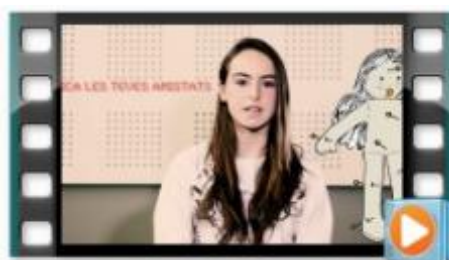
Prou violència masclista!